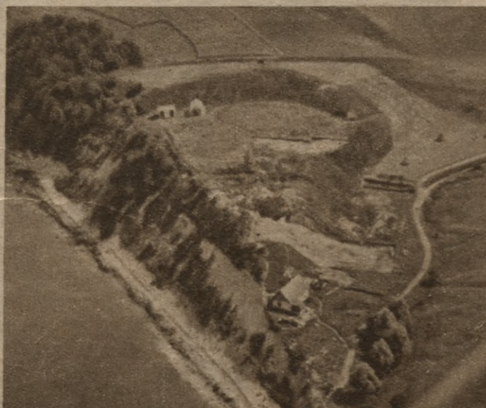
Daugmales pilskalns no putnu lidojuma.