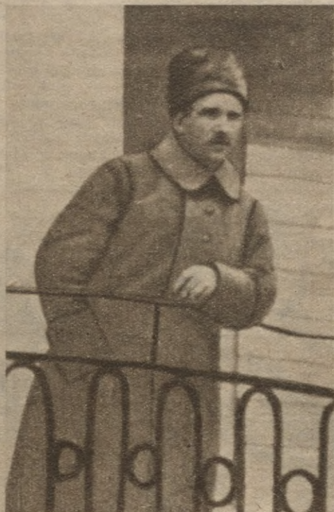
Pulcvežs O. Kalpaks Rudbāržu muižā 1919. g. februārī.

Tas bija viens no drūmākajiem brīžiem latvju tautas dzīvē, kad 1919. g. 3. janvārī plkv. Kalpaks ar nelielu latviešu kaņavīru pulciņu atstāja Rīgu. Zeme iepriekšējās kara un revolūcijas gados bija izpostīta, no austrumiem vēlās boļševiku armijas lavīna, kam pretī stāties varēja tikai niecīga saujņa latviešu un vācu pilsoņu kaņatāju. Tiem pievienojās arī daļa valsts vācu kaņavīru. Taču šie spēki atradās vēl organizēšanas stadijā, bez kopējas vadības. Tā radās tikai pēc Rīgas krišanas, kad vadību par visām kaņujas spējīgām vienībām uzņēma landesvēra Oberštabs. Boļševikiem līdzī sekoja asiņains terrords, kam drīzi vien pievienojās ne mazāk briesmīgs viesis — bards.