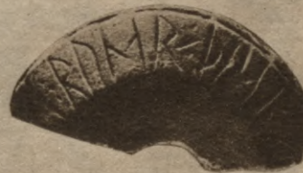
Akmens priekšmeta lauska ar rūnu ierakstu: „rūnas rakstija...”