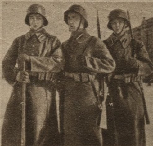
I atsevišķā bataljona studentu rotas kaņavīri.

1. martā plkv. Kalpaks saņēma kaņujas pavēli gatavoties uz vispārēju uzbrukumu, kurā bez latviešu atsevišķā bataljona piedalīsies arī Dzelzs divīzija. Atsevišķajam bataljonam uzdeva, pārejot Ventu, ieņemt Jauno muižu. Uzbrukums sākās 3. martā agrī no rīta un vainagojās panākumiem. Jauno muižu ieņēma un noturēja, lai gan boļševiki trīs dienas izdarīja spēcīgus pretuzbrukumus. 5. martā bataljonam pavēlēja turpināt iesāktu uzbrukumu, ieņemt Skrundas skolu, izvīzīties līdz Grāveru muižai un Skudru mājām un tur apvienoties ar Dzelzs divīzijas Borchas (Borch) bataljonu. Atsevišķajam bataljonam piedalīja leitnanta Srūndera (Schründer) pusbateriju. Otrā dienā, gaismai austot, divas bataljona rotas de-