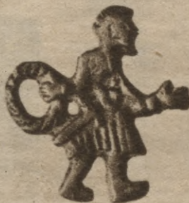
XI g. s. vikinga bronzas plakete.