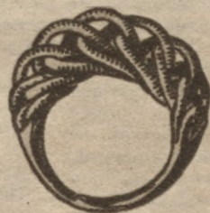
XI g. s. sudraba gredzens, kas tagad atkal modē.

Daugmales pils pēdējo reizi izpostīta 12. g. s. un pēc tam vairs nav uzcelta. Arī agro vēstures laiku rakstu avotos — chronikās tā nav minēta.