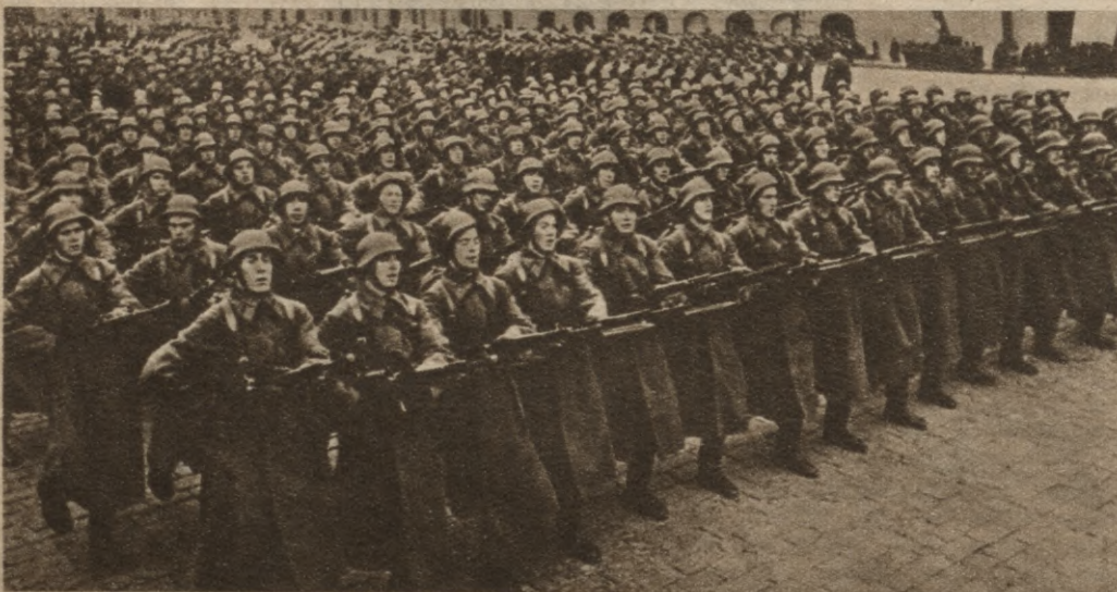
2) Šeit parādes solī iet trulie padomju ieroču kalpi — roboti.