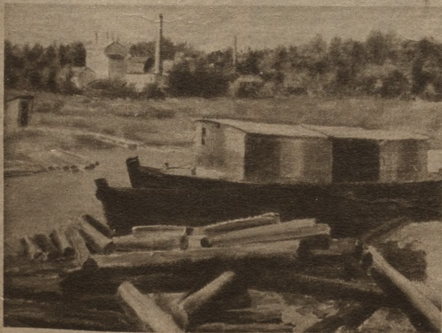
V. Mednis — Ķīpsalas ainava.