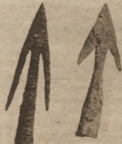
Dzelzs bultu uzgaļi.