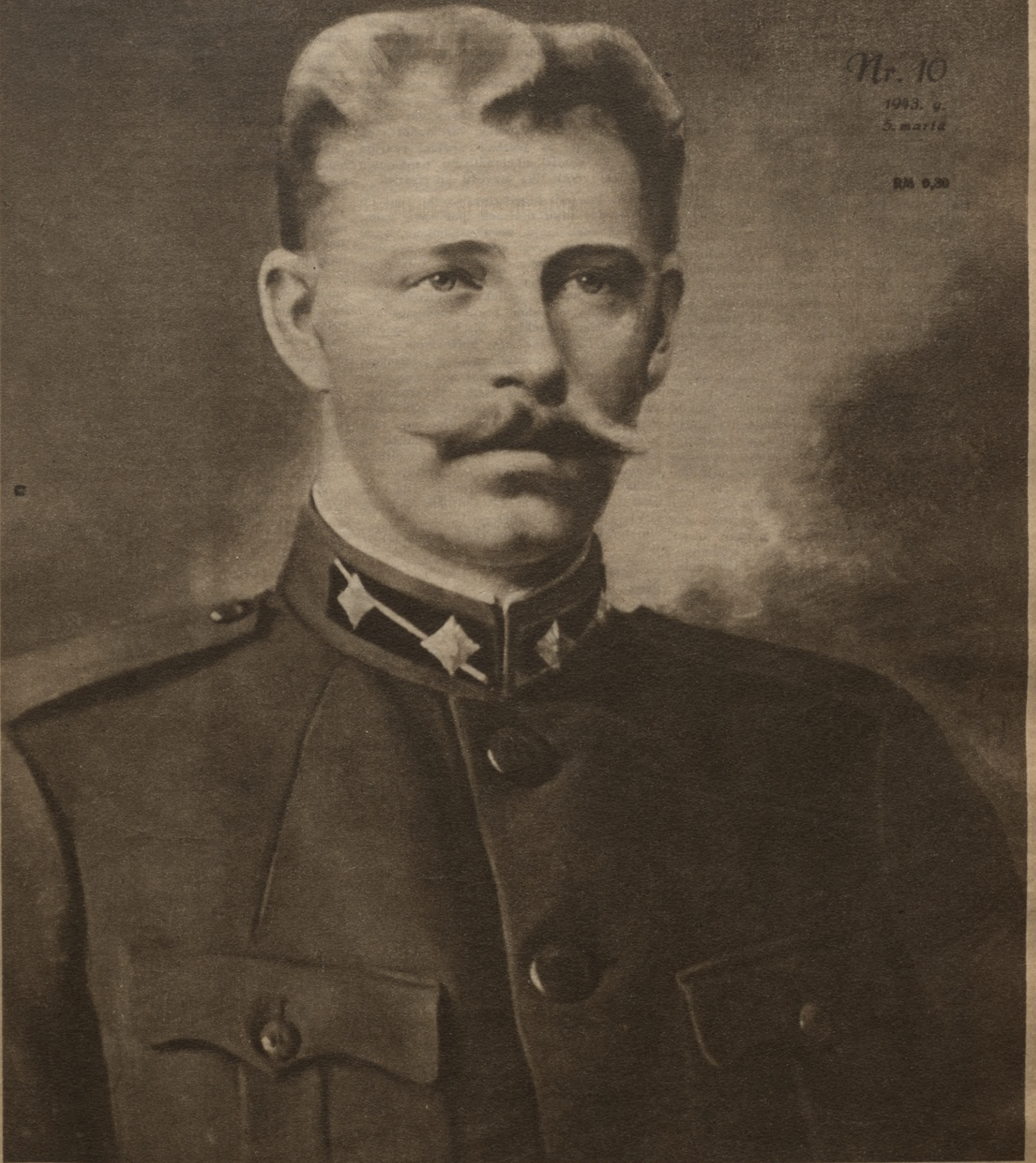
Pulkvedis Oskars Kalpaks